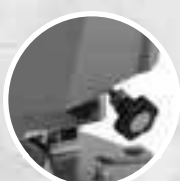
Передняя ручка регулирующая угол наклона щетки