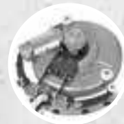
Всасывающая балка и вращение (до 270°)