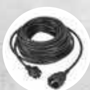
Удлинитель 15 м