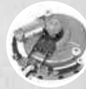
Всасывающая балка и вращение (до 270°)