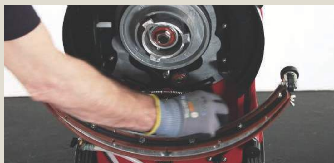
Снять скребок, проверить и очистить лезвия.