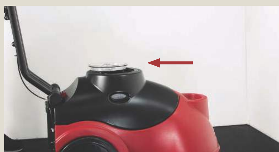
Оставить машину с открытой крышкой бака грязной воды.