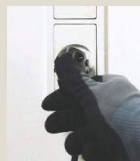
Подключить зарядное устройство к розетке.