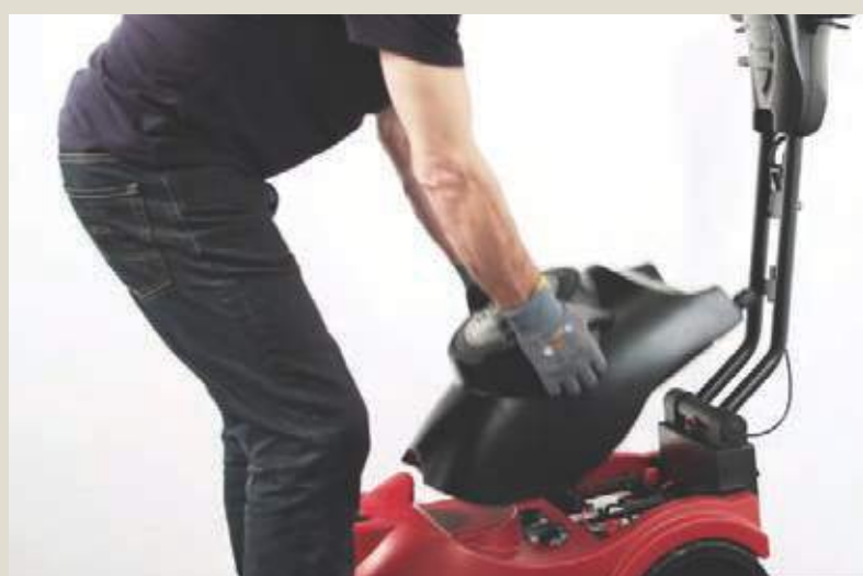
Опорожнить бак грязной воды.

Руководство по эксплуатации модели AS380/15