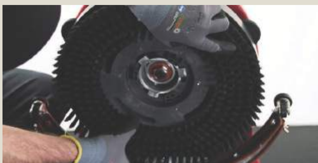
Осмотреть щётку или пэд.