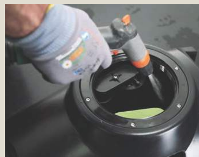
Очистить бак грязной воды.