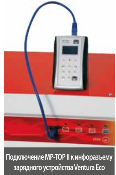
Подключение MP-TOP II к инфоразъему зарядного устройства Ventura Eco