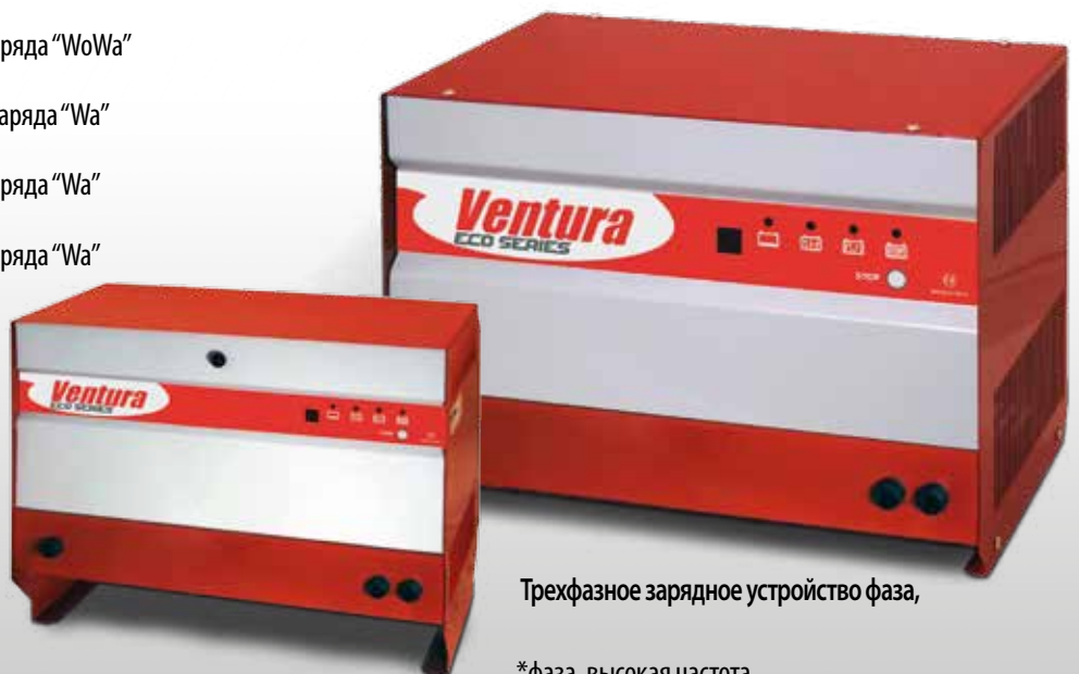
Однофазное зарядное устройство